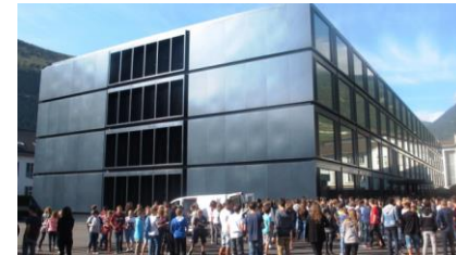
Collège Octodure Martigny

Austauschwoche (Sa 18. März – So 26. März 2023)